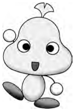
いちはら銀杏の会 マスコットキャラクター 「イチチーくん」

第2回 いちはら銀杏の会の開催が4月24日(水)に決定しました。当会は、市原市全域の「産」「官」「学」「農」「観」など様々な分野の交流を図ることを目的に、昨年12月に380名の参加を得て発足されました。