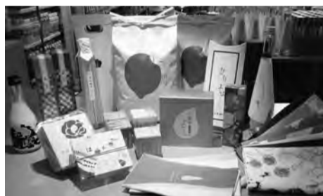
地元産品をアートなデザインパッケージで販売(写真はイメージ)

審査会が開催され、アート×ミックス向け名産品が選定されることとなります。アートとコラボレーションしたいという商品を募集いたしますので、詳しくは、説明会でご案内いたします。 【問合せ先】 市原商工会議所リデザイン・プロジェクト事務局 TEL(22) 4305 【予告】 3月21日(木)いちはらアートミックス、リデザイン・プロジェクトの説明会を行う予定です。 場所…市原商工会議所